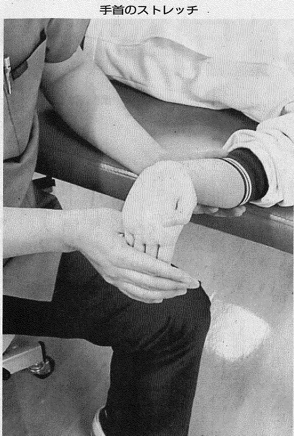
手首のストレッチ